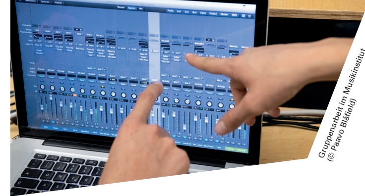
Gruppenarbeit im Musikinstitut