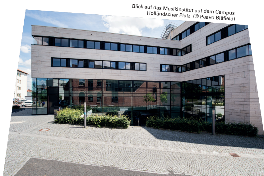
Blick auf das Musikinstitut auf dem Campus Holländischer Platz

Innerhalb der Universität Kassel gibt es eine Zusammenarbeit mit dem Institut für Wirtschaftsrecht. Darüber hinaus wurde eine Kooperation mit der Universität Paderborn (Musikwissenschaftliches Seminar Detmold/Paderborn) vereinbart.